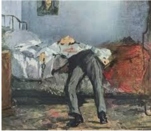
Le corps d'un suicidé