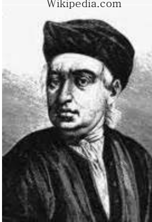
Jean Calas

En 1761, sous le règne de Louis XV, la mise à mort d'un commerçant protestant âgé, Jean Calas, par le Parlement de Toulouse, secoue les esprits. Jean Calas est accusé du meurtre de son fils Marc-Antoine et est condamné sans preuve sérieuse. Il crie son innocence jusqu'à son dernier souffle, mais en vain. Son exécution se déroule de façon terrible : il est roué, étranglé et son corps est finalement brûlé.