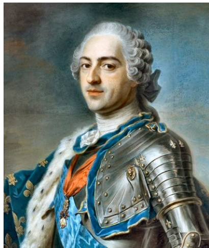
Louis XV Noblessetroyautes.com