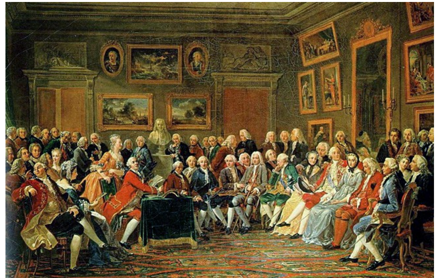
Salon de Madame Geoffrin